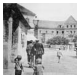
2 Sídlo Kaplnky – budova YMCA