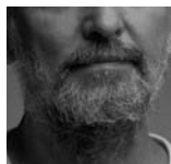
2 Rána medzi oči