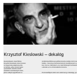
3 Krzysztof Kieslowski – dekalóg