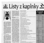
1 Listy z Kaplnky – Úvodník