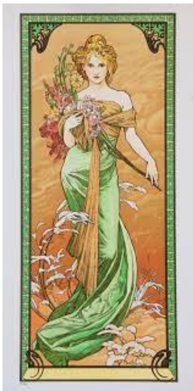
Alfons Mucha, 1896

Buďte teda trpezliví, bratia, až do príchodu Pána. Pozrite: Roľník vyčkáva vzácnu úrodu zeme a trpezlivo čaká, kým nedostane jesenný i jarný dážď. (Jakubov list, 5:7)