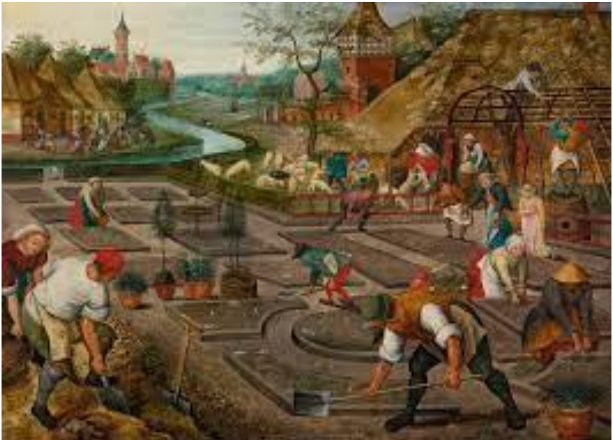
Pieter Breughel, 1620 – 1630

Pod'te, vrá'tme sa k Hospodinovi! On nás totiž roztrhal a on nás aj uzdraví, on nás udrel a on nás aj obviaže. Po dvoch dňoch nás oživí, na tretí deň nás vzkriesi a budeme žiť pred jeho tvárou, spoznáme ho a budeme sa usilovať o poznanie Hospodina. Jeho východ je istý ako východ rannej zory a jeho príchod je pre nás ako príchod dažďa, jesenného a jarného dažďa, ktorý zvlažuje zem. (Ozeáš, 6:1 – 3)