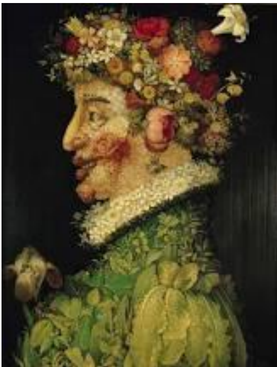
Giuseppe Arcimboldo, 1573

Človek v srdci zvažuje svoju cestu, no Hospodin jeho kroky usmerňuje. Božie rozhodnutie je na perách kráľa, jeho ústa sa nespreneveria na súde. Presné váhy a miery patria Hospodinovi, všetky záväžia v mešci sú jeho dielom. Kráľom sa protiví hriešne konanie, lebo trón sa upevňuje spravodlivosťou. Králi majú v obľube spravodlivé pery, milovaný je ten, čo hovorí pravdu. Kráľov hnev je posol smrti, múdry muž ho uzmieri. V jase tváre kráľa sa zračí život, jeho priazeň je ako oblak jarného dažďa. (Príslovia, 16:9 – 15)